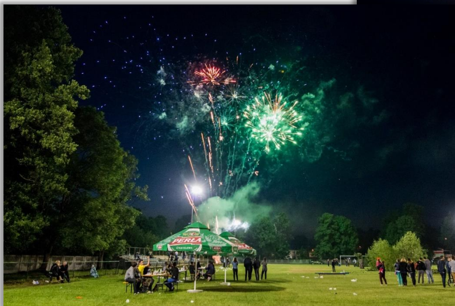
Pokaz sztucznych ogni na stadionie w Dzikowcu